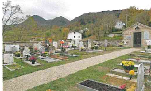
Il cimitero di Capanne

«Stante l'inopportunità di procedere alla lavorazione nella stagione invernale - si legge nella determina di revoca dei lavori dell'Unione dei Comuni - con determina del 16/12/2020 si è provveduto ad affidare i lavori allo scopo di avviare le opere nella primavera 2021». Ma poi solamente lo scorso 13 aprile, anche a causa dell'emergenza Covid, è stato possibile un incontro a distanza a seguito del quale la ditta ha formalizzato una serie di osservazioni. Tali osservazioni «principalmente riguardano un