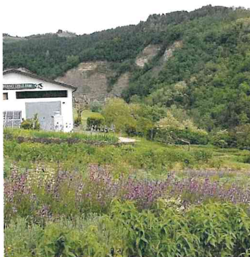
Uno scorcio dei boschi che circondano Casola Valsenio

Per quanto riguarda l'Unione della Romagna Faentina, ad esempio, è un dato di fatto la presenza massiccia di conifere: è questa specie, per le sue caratteristiche naturali, a presentare il potenziale maggiore di rischio incendio. «Le conifere – prosegue Sangiorgi – furono