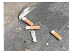
Mozziconi gettati in strada

Allo scopo di preservare la salute e la pulizia dell'ambiente il Comune di Casola Valsenio e il Gruppo Hera hanno pensato a una speciale bustina-posacenere da tasca. Si tratta di un aiuto per conservare le cicche di sigaretta fino al cestino più vicino e contribuire, con un piccolo grande gesto, a un ambiente migliore per tutti. Come spiegano i promotori dell'iniziativa, «se vuoi bene al tuo paese, usa gli appositi contenitori collocati in ogni cestino porta-rifiuti o le apposite bustine tascabili, messe a disposizione da Hera e disponibili gratuitamente presso le tabaccherie».