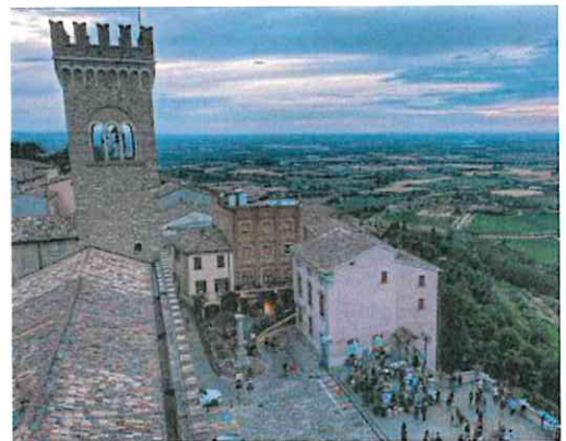
Bertinoro al tramonto con la torre del municipio

Dall'altra parte, però, il centrodestra sembra avere le idee più chiare, ora che ha fiutato l'occasione di espugnare in un colpo solo sia il Municipio, sia la Provincia. Si sa che l'associazione Civitas e la vecchia lista di opposizione "Uniti per cambiare" si presenteranno insieme con la lista BartrOra, ma chi sa-