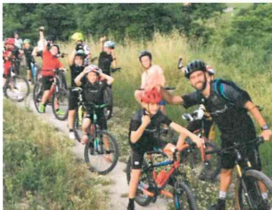
Giovani ciclisti a scuola di Mtb sulle colline dell'alto Bidente