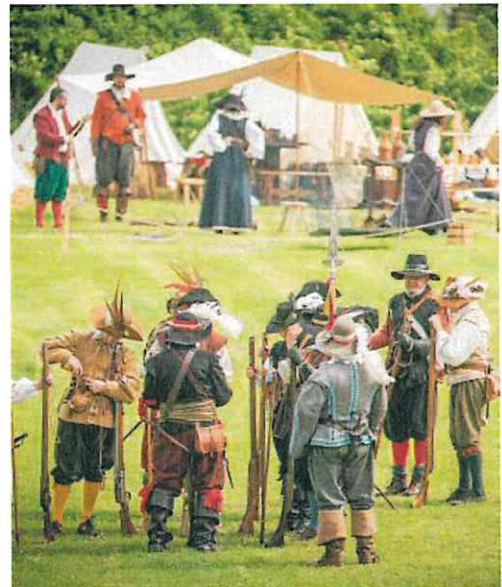
Tuffo nel passato con la rievocazione Eliopoli

370 I FIGURANTI CHE HANNO PARTECIPATO NEL 2018