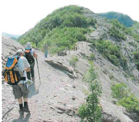
Escursionisti verso il passo di Serra