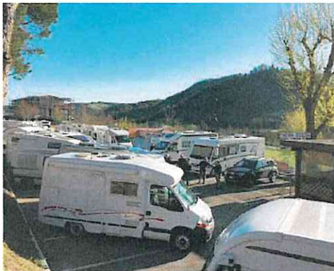
Appuntamento per gli appassionati camperisti

re diversi borghi e contesti ambientali suggestivi, con una miriade di opportunità, occasioni, offerte speciali e sconti riservati al benvenuto "popolo dei camper".