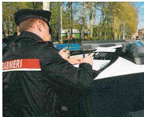
Bilancio del controllo del territorio da parte dei Carabinieri

Durante l'operazione, i carabinieri del Nucleo Operativo e Radiomobile, la notte scorsa, in via Bertini, hanno proceduto al controllo del conducente di un'autovetture risultato poi positivo all'alcoltest, con tasso alcolemico tre volte superiore al limite consentito. È stata immediatamente