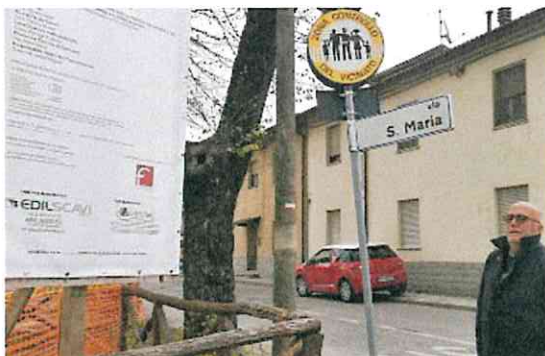
CARTELLO SEGNALETICO Si avvisa che il Controllo è in zona

IL progetto è stato avviato sulla base di un primo protocollo d'intesa fra l'amministrazione comunale e la riconosciuta associazione del controllo del Vicinato. Nel 2017 ha ricevuto il riconoscimento istituzionale con il protocollo d'intesa fra l'amministrazione comunale, la prefettura, le forze dell'ordine facenti parte del Comitato Provinciale per l'ordine e la sicurezza. L'espansione e il radicamento del progetto è continuata progressivamente sino ai giorni scorsi con la costituzione di tre nuovi gruppi di controllo. I tre nuovi gruppi, come detto di recente