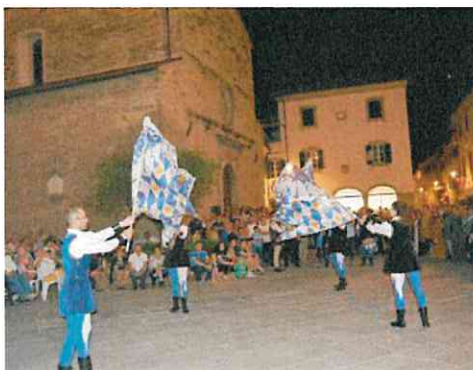
I Giorni del Capitano