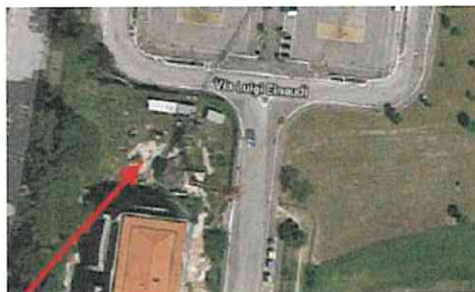
L'area che verrà acquistata

In precedenza la sola maggioranza aveva approvato le variazioni al bilancio di previsione. Tra queste l'inserimento a bilancio di 217.000 euro provenienti dallo Stato come fondo destinato ai Comuni per pareggiare eventuali situazioni di squilibrio in questa annata particolare. La cifra al momento è stata accantonata a riserva. Inoltre è stato inserito a bilancio un contributo di 169.000 euro derivante dalla produzione di energia alternativa sui tetti di edifici pubblici, destinati per 60.000 euro a com-