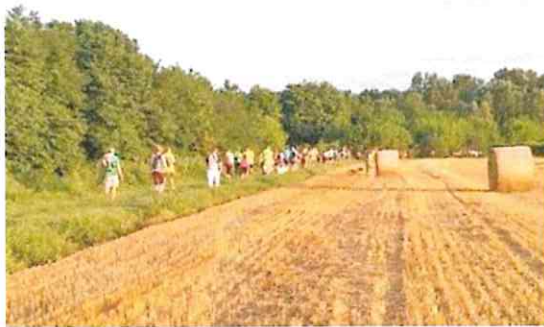
Escursionisti lungo il tracciato della Via Romea tra Ronco Lido e Fratta Terme

Il primo progetto dal titolo 'Percorrere le vie di pellegrinaggio dagli appennini al Delta del Po-itinerari nelle aree rurali dell'Emilia-Romagna' «si pone l'obiettivo – aggiunge Biserni –, tramite un approccio partecipato, di migliorare itinerari e percorsi sotto il profilo della mappatura e della ricognizione, dell'ospitalità, dell'enogastronomia tipica e della promozione e comunicazione. In particolare le aree di competenza del Gal L'Altra Romagna interessate dal