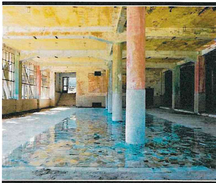
L'interno della sala Milleluci come si trova oggi, in disuso da decenni