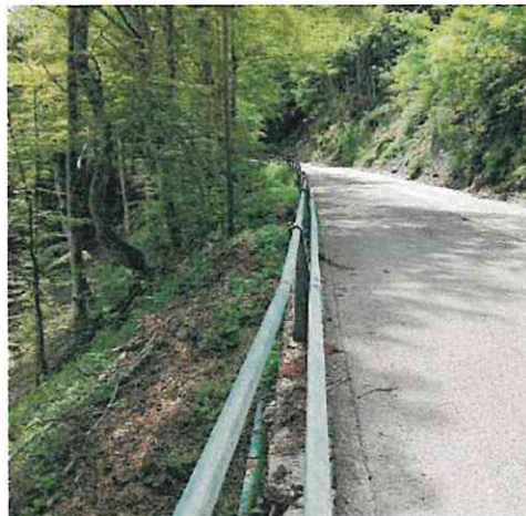
Una delle zone dove sono previsti i lavori

Un primo intervento riguarda un tratto di un centinaio di metri, oltre l'edificio del "Raggio", sulla sinistra della strada salendo verso il passo. Qui occorrerà rimuovere la barriera laterale esistente, sistemarne una nuova e fissarla su una struttura in cemento armato, tale da resistere ai carichi derivanti da un eventuale urto di un mezzo pesante. In questo tratto oggetto di smontamento la soletta di fondazione sarà incastrata a micropali. Un secondo intervento è previsto circa 300 metri più avanti, sempre sulla sinistra salendo, poco prima dell'edificio dell'ex ristorante "Tre Botti". In questo punto occorre ripristinare il muretto in pietra parzialmente crollato e un tratto di barriera metallica in acciaio. Inoltre so-