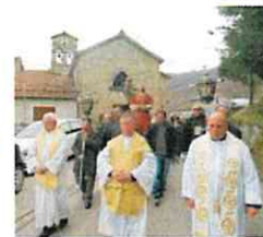
Celebrazione a Pereto