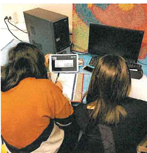
Le lezioni a distanza

«Si tratta di misure che rappresentano una prima risposta immediata alle nostre famiglie e ai nostri giovani studenti - conclu-