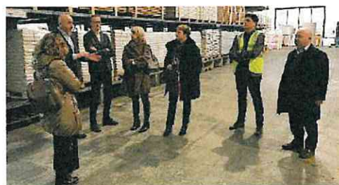
La visita alla Graziani Packaging