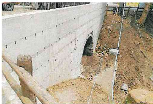
Il ponte dopo le opere di consolidamento in cemento

Il Comune di Santa Sofia, grazie al finanziamento di 75mila euro assegnato dalla Regione, si è avvalso per la progettazione e direzione lavori del Servizio Area Romagna dell'Agenzia regionale per la sicurezza territoriale e la