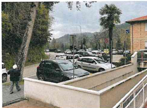
Le vetture ammassate davanti all'ospedale mercatese

Scomodo, per ora, anche avvisare la polizia locale chiedendo di intervenire per multare la sosta selvaggia. Il clou dell'intasamento di solito è al mattino. Con il Corpo della polizia locale accorpato ora a quello di Cesena, chi ha chiamato per avere aiuto e liberare l'area dalla sosta selvaggia, oltre a scontrarsi con una strana burocrazia di segnalazione della problematica, ha dovuto prendere atto che dalle 9 del mattino (momento della richiesta di soccorso ai vigili) una pattuglia è arrivata sul posto alle 14.30, quando la sosta selvaggia era cessata.